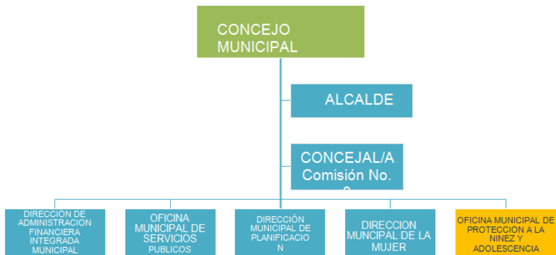
Gráfica No. 1 Posición de las OMPNA en la estructura municipal.

Dentro de la municipalidad, la OMPNA ocupa un lugar específico que le permite funcionar como parte de la estructura de la organización municipal. A continuación una gráfica que permite visibilizarlo: